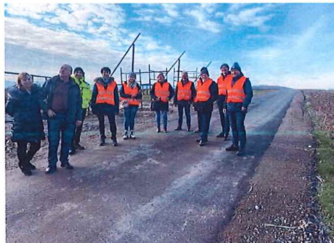
Przebudowa drogi w Stoszowicach Kolonii

Na uwagę zasługują poniesione w 2022 r. wydatki majątkowe dotyczące przebudowy dróg gminnych w nw. miejscowościach: