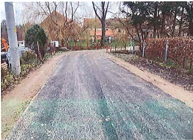
Przebudowa drogi w Budzowie