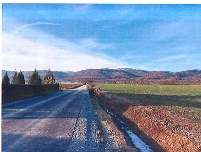
Przebudowa drogi Grodziszcze - Grodziszcze Kolonia