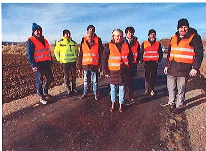
Przebudowa drogi w Przedborowej