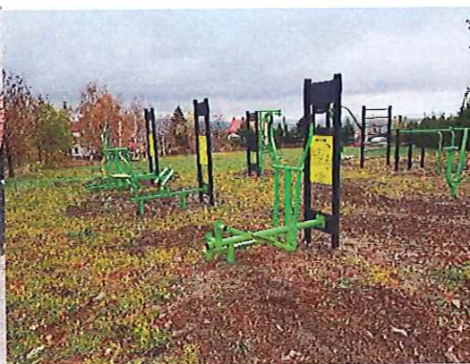
Sołectwo Srebrna Góra