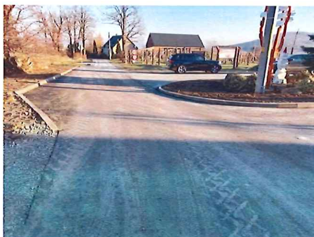
Przebudowa drogi w Mikołajowie