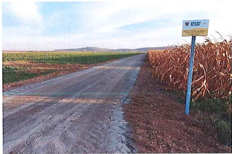
Przebudowa drogi dojazdowej do gruntów rolnych Budzów - Stoszowice