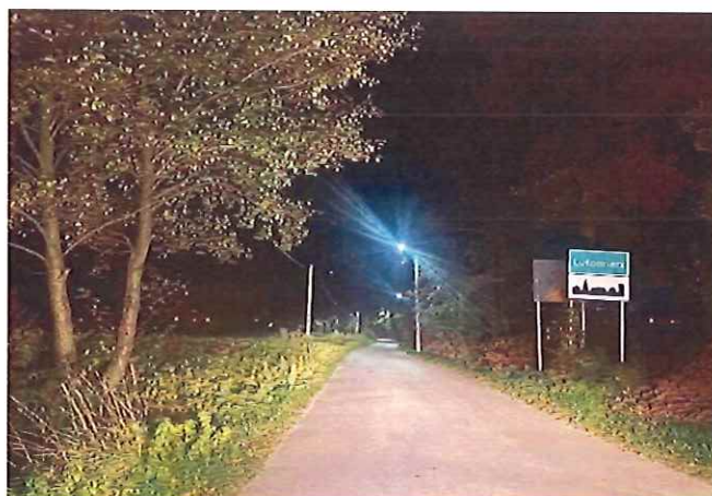
Budowa oświetlenia ulicznego w Lutomerzu i Lutomerzu Kolonii