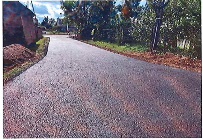
Budowa przejścia dla pieszych na drodze gminnej wraz z przebudową drogi oraz wykonaniem oświetlenia w miejscowości Lutomierz na terenie działki nr 423 oraz 427