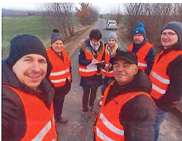
Przebudowa dróg w Stoszowicach