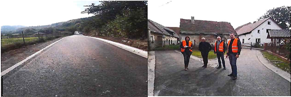
Przebudowa dróg w Srebrnej Górze i Budzowie