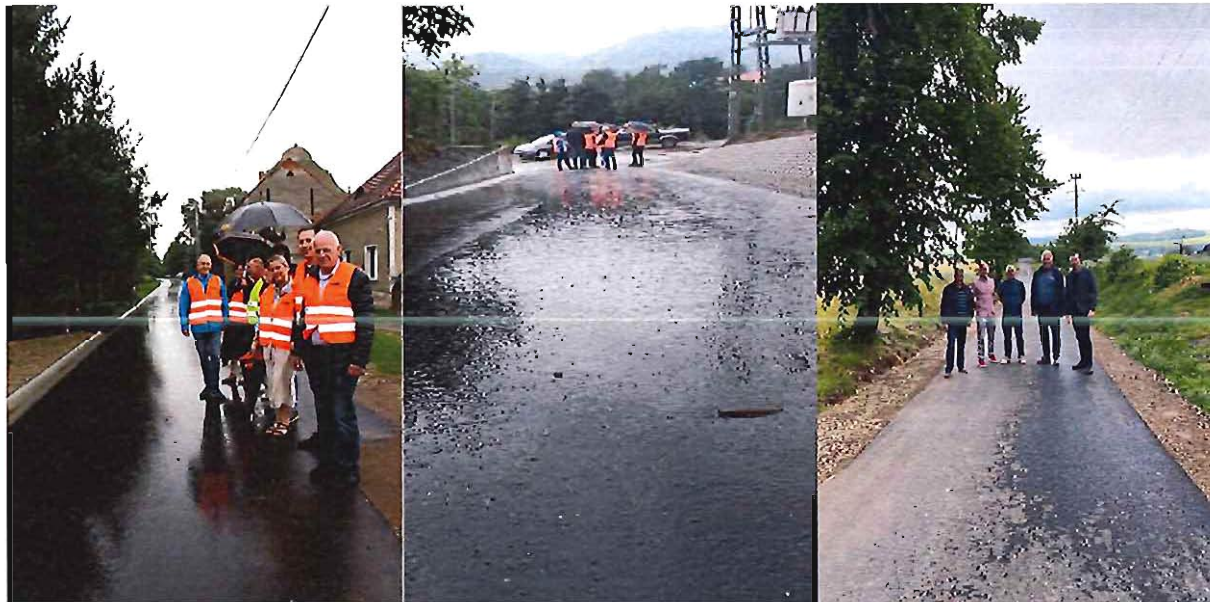
Przebudowa dróg w Lutomerzu i Grodziszczu