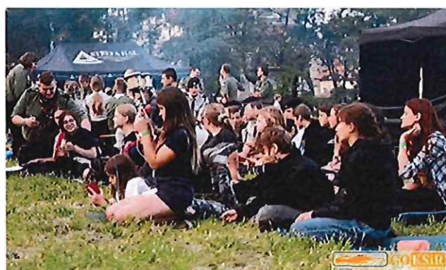
Srebrnogórski Festiwal Piosenki Harcerskiej LILIJKA

Obostrzenia zdominowały również codzienną pracę Ośrodka. W kwietniu 2021 roku nie odbywały się zajęcia amatorskie, a instytucja była zamknięta dla osób z zewnątrz.