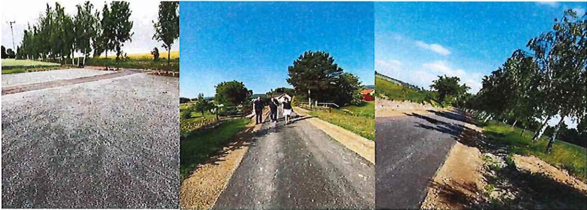
Przebudowa dróg w Przedborowej i Różanej