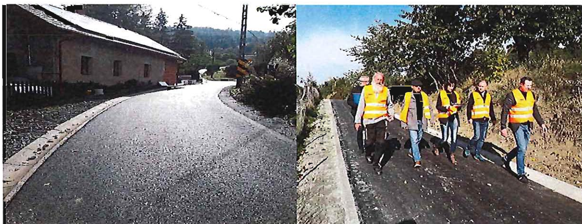
Przebudowa dróg w Żdanowie i Srebrnej Górze

W objętym przez raport okresie gmina otrzymała 2 251 041,19 zł związanych z realizacją inwestycji. Z tytułu refundacji wydatków na przedsięwzięcia z funduszu sołeckiego to kwota ogółem 18 187,58 zł. Środki otrzymane w ramach Rządowego Funduszu Inwestycji Lokalnych dla gmin górskich, które gmina w części wydatkowała w 2021 r., a pozostałe zamierza wydatkować w 2022 roku na infrastrukturę sportową, turystyczną, społeczną to kwota 1 905 416,01 zł. Na budowę 2 laboratoriów przyszłości w szkole podstawowej otrzymano środki w wysokości 120 000,00 zł. Dotacja z Rządowego Funduszu Dróg na budowę przejścia dla pieszych wraz z przebudową drogi w Lutomierzu oraz wykonaniem oświetlenia, wyniosła 117 437,60 zł. Zadanie będzie realizowane w 2022 r. Dotację z samorządu wojewódzkiego na odbudowę pawilonu w zabytkowym parku w Grodziszczu otrzymano w wysokości 90 000,00 zł.