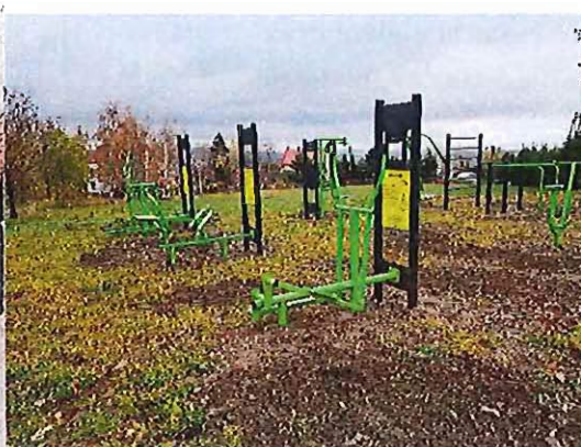
Sołectwo Srebrna Góra