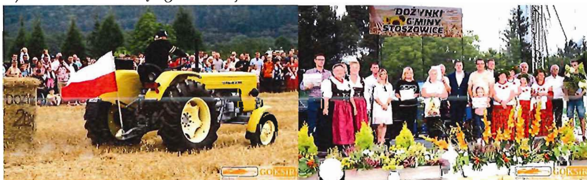
Dożynki Gminne 2021

Ze względów epidemicznych nie odbyła się jedna z głównych imprez, zaplanowana na pierwsze półrocze 2021 roku, którą była X Srebrnogórska Majówka. W zamian za brak możliwości organizacji tejże imprezy, spowodowany obostrzeniami