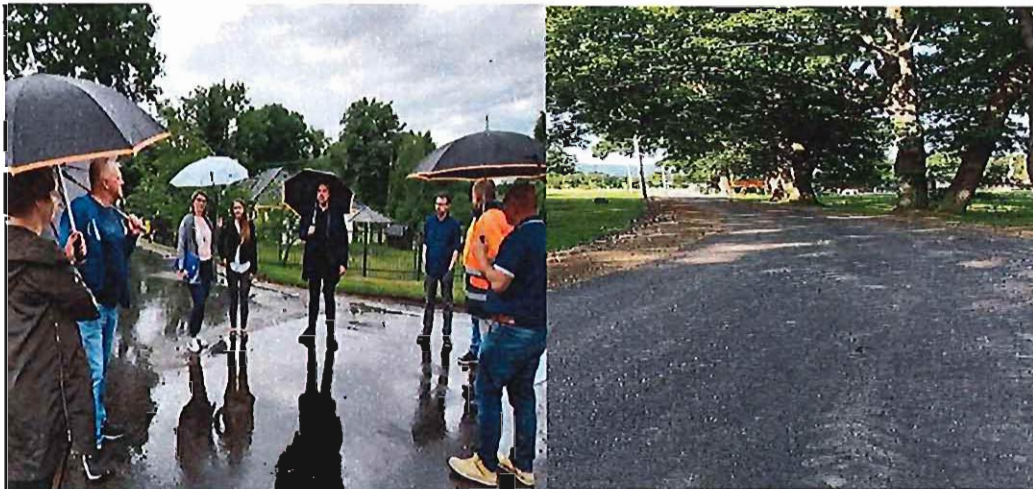
Przebudowa drogi w Rudnicy

Na uwagę zasługują poniesione w 2021 r. wydatki majątkowe dotyczące przebudowy dróg gminnych w nw. miejscowościach: