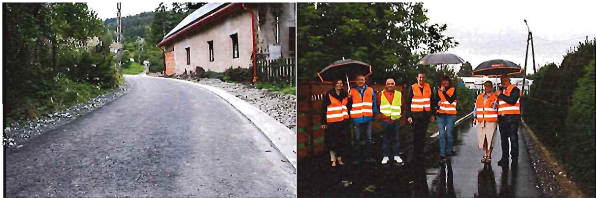
Przebudowa dróg w Żdanowie i Lutomerzu