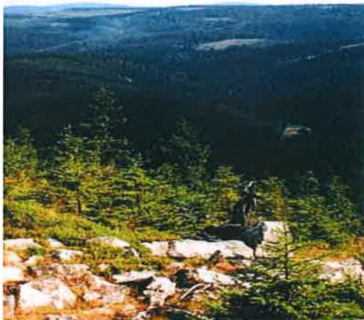
Rysunek Widok z wieży na Górze zamkowej

Wśród różnorodnej zabudowy w Grodziszczu można spotkać ciekawe obiekty. Znajduje się tam kościół (rok budowy ok. 1497), wewnątrz którego zachowała się ambona z XVII w.