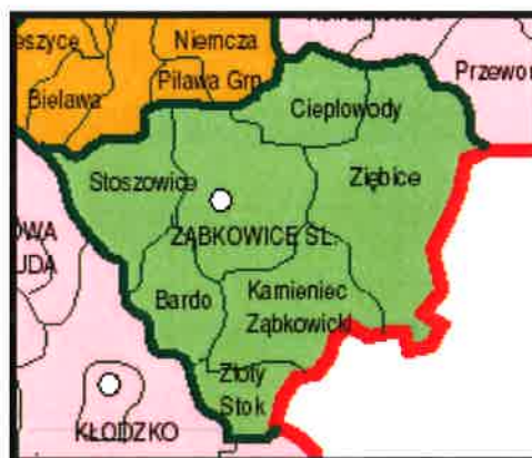
Rysunek .Powiat ząbkowicki

Gmina Stoszowice położona jest około 200 km od Pragi, 350 od Wiednia i Berlina, oraz około 400 od Warszawy. W pobliżu gminy przebiega krajowa ósemka, co czyni ją łatwo dostępną dla potencjalnych turystów. Z tego względu oraz głównie dzięki walorom krajobrazowym, potencjalnym kierunkiem rozwoju dla miejscowości z Gminy Stoszowice, w tym także dla Grodziszcz, jest szeroko rozumiana agroturystyka.