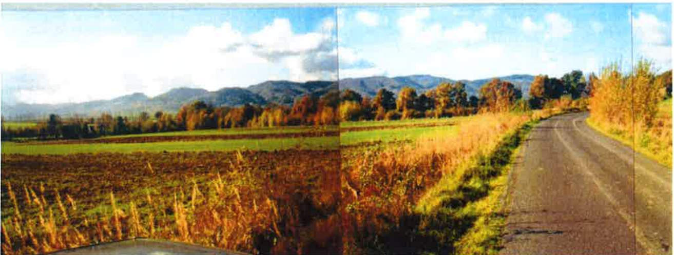
Rysunek Okolice Grodziszczca

Okolice wsi są malownicze, co predysponuje ją do rozwijania funkcji turystycznej. Poniżej widok na Góry Sowie.