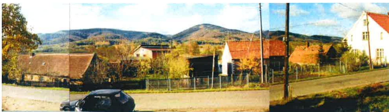
Rysunek Zabudowania wsi Grodziszczce na tle Gór Sowich

Dodatkowo o atrakcyjności wsi świadczy duża liczba zabytków architektury. Mimo iż większość z nich jest mocno zaniedbana bądź wręcz zdewastowana, stanowią one potencjalny atut. W przypadku ich odrestaurowania, Grodziszczce ma będzie jedną z najładniejszych wsi w okolicy.