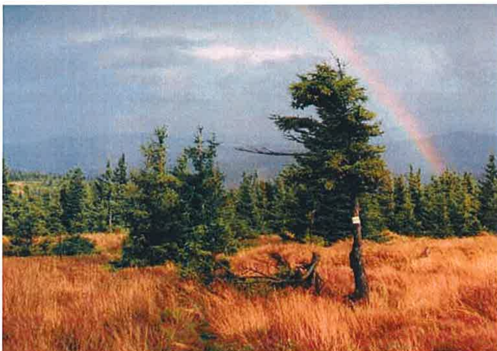
Rysunek Widok na Góry Sowie.