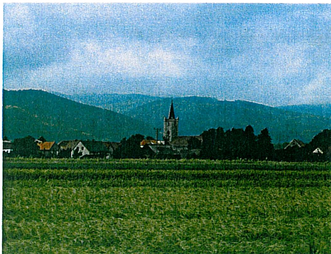
Rysunek 3 Wieś Budzów

Budzów to wieś o typowo rolniczym charakterze, ale na jej terenie funkcjonuje też kilka zakładów usługowych. W filii Biblioteki Publicznej znajduje się punkt dostępu do Internetu, w ramach gminnej sieci szerokopasmowej eVita.