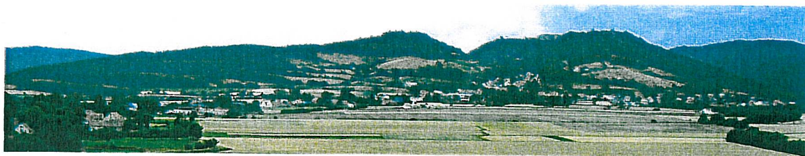
Rysunek 2 Widok na Srebrną Górę

Okolice wsi są malownicze, co predysponuje ją do rozwijania funkcji turystycznej. Poniżej widok na Góry Sowie.