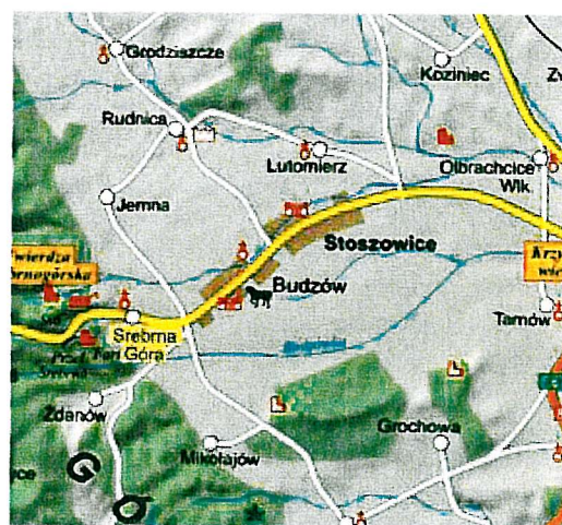
Rysunek 1. Powiat ząbkowicki

Gmina Stoszowice położona jest około 200km od Pragi, 350 od Wiednia i Berlina, oraz około 400 od Warszawy. W pobliżu gminy przebiega krajowa ósemka, co czyni ją łatwo dostępną dla potencjalnych turystów. Z tego względu oraz głównie dzięki walorom krajobrazowym, potencjalnym kierunkiem rozwoju dla miejscowości z Gminy Stoszowice, w tym także dla Budzowa, jest szeroko rozumiana agroturystyka.