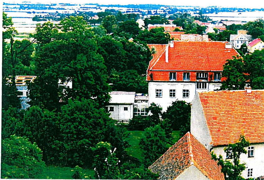
Rysunek 5 Widok na Publiczne Gimnazjum w Budzowie

Dodatkowo o atrakcyjności wsi świadczy duża liczba zabytków architektury. Mimo, iż większość z nich jest mocno zaniedbana bądź wręcz zdewastowana, stanowią one potencjalny atut. W przypadku ich odrestaurowania, Budzów będzie jedną z najładniejszych wsi w okolicy.